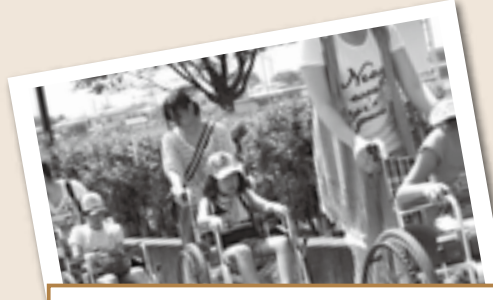
○車イスで街を歩こう 車イスに乗っているほうが暑く感じました。特に夏は利用者をしっかり見なければいけないと思いました。