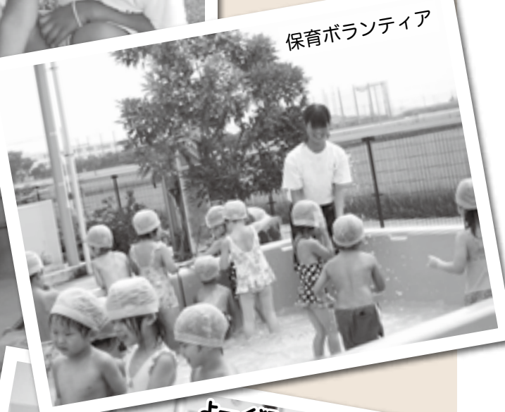
保育ボランティア