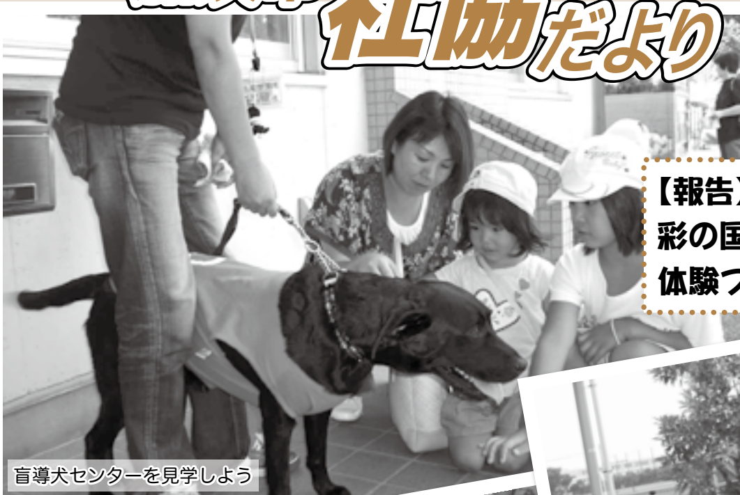
盲導犬センターを見学しよう

発行所 社会福祉法人 加須市 社会福祉協議会 加須市下三俣307番地 TEL 0480-62-6451 FAX 0480-62-6546 http://www2.kazosyakyo.jp/