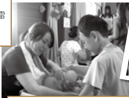
○お楽しみ会ボランティア 暑かったけど、楽しい一日でした。子どもたちの笑顔が良かったです。