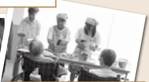
○万葉の郷おやつボランティア 初めは、ドキドキしたけど、おいしいおやつが作れました。