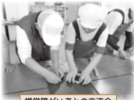
視覚障がい者との交流会