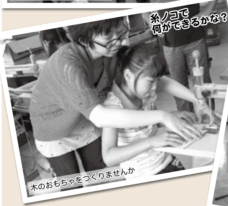
糸ノコで 何が できるかな？