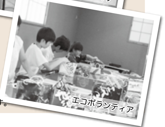
エコボランティア