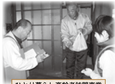
ひとり暮らし高齢者訪問事業 (配食サービス)