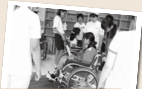
○中学生のいろいろ福祉体験 段差での介助方法を学びました。

7・8月に各種ボランティア体験事業を実施しました。夏の暑い中、多くの子どもたちが参加しました。