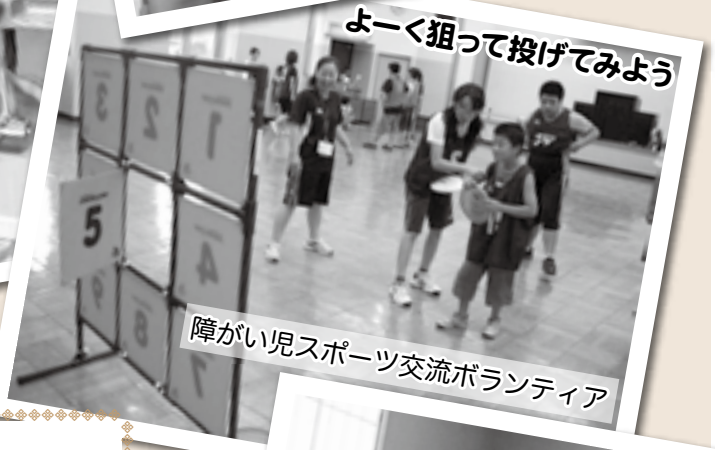
よく狙って投げてみよう