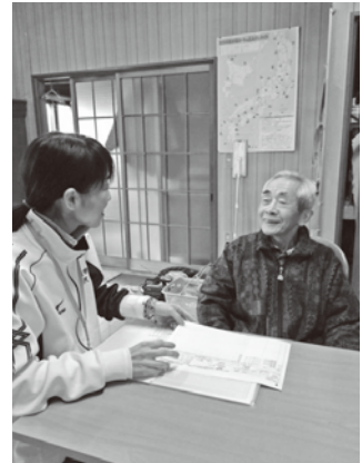
▲ケアプラン作成中