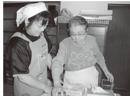
▲ヘルパーさんと一緒に食事の支度!!