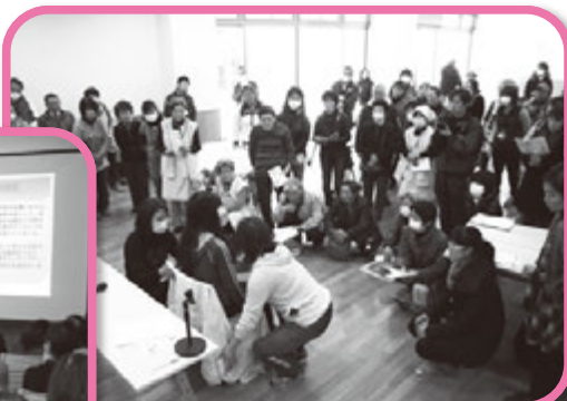
▲加須消防署にて 災害時生活支援体験の講習