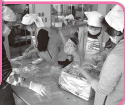
▲あけぼの園にて 赤十字奉仕団による炊き出し