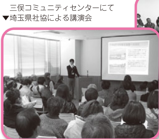
三俣コミュニティセンターにて ▼埼玉県社協による講演会