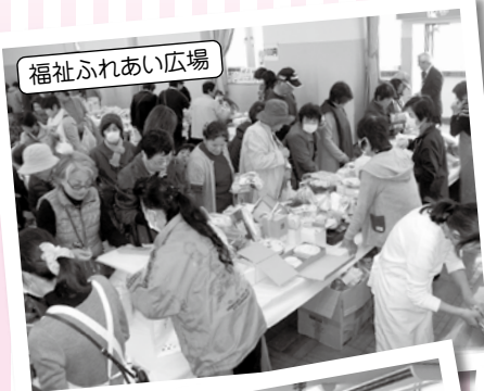
福祉ふれあい広場