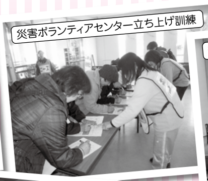
災害ボランティアセンター立ち上げ訓練