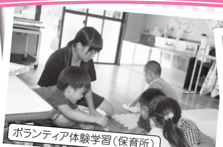
ボランティア体験学習(保育所)