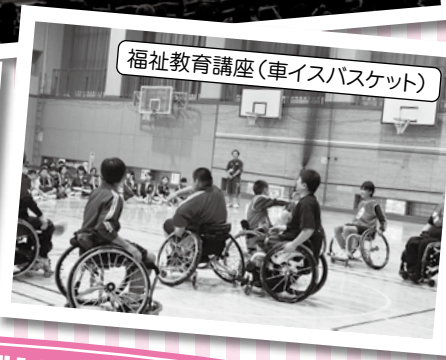
福祉教育講座(車イスバスケット)