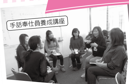
手話奉仕員養成講座