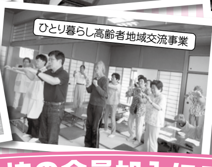
ひとり暮らし高齢者地域交流事業