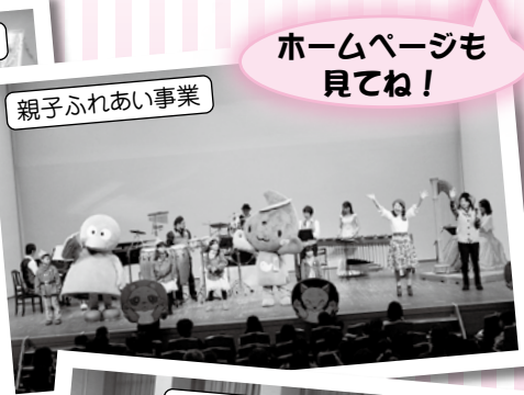
親子ふれあい事業