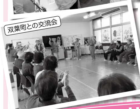
双葉町との交流会