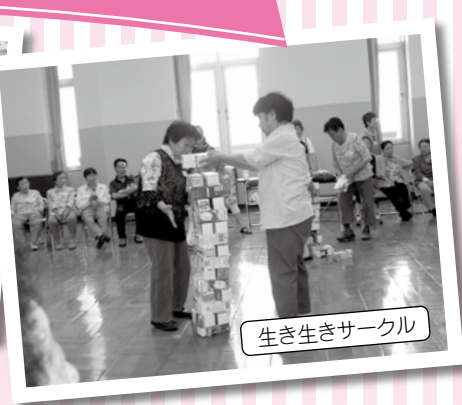
生き生きサークル