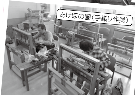
あけぼの園(手織り作業)