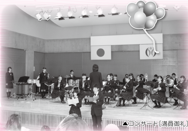
▲コンサート[満員御礼]