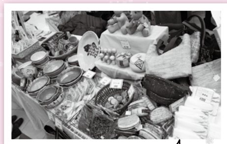
あけぼの園では陶芸のお皿や 織物のポーチや人形などを販売