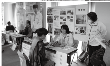
市内の福祉施設及び団体が実施する 様々な活動内容を各ブースで紹介