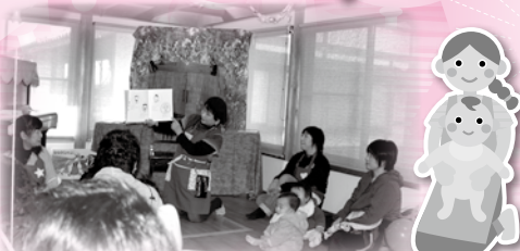
▲読み聞かせ・手遊び[楽しそう]