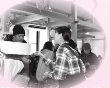
▲模擬店[おいしいものたくさん]