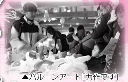
▲バルーンアート[力作です]