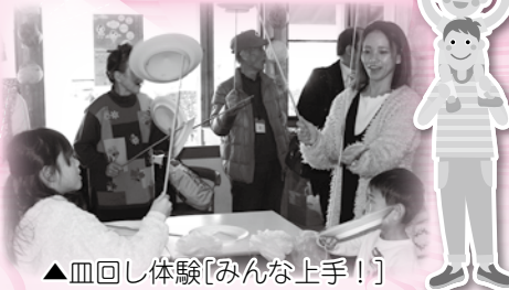
▲皿回し体験[みんな上手!]