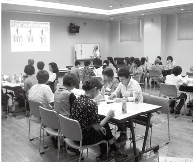
▲ボランティア団体への説明会の様子