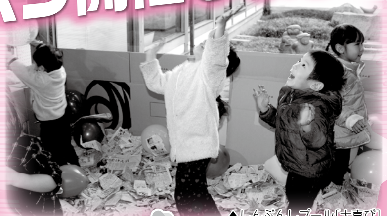
▲しんぶんしプール[大喜び]