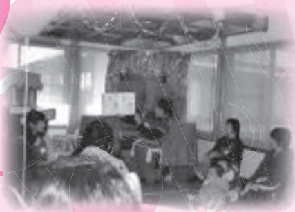
▲手遊び・読み聞かせ

歌ったり踊ったり笑ったり、あなたも「ぼんぽこ♪あそびのひろば」に参加して楽しいひと時を過ごしましょう。