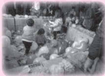
▲しんぶんしプール