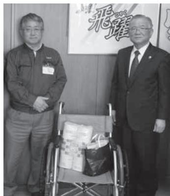
日本ワイパブレード(株)様より車いす等をいただきました。

※1,000円以上のご寄附をいただいた方で、ご承諾をいただいた方々を掲載させていただきました。