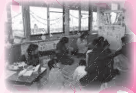
▲親子ひろば・子育て相談会