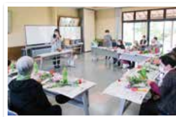
～北川辺支部 地域交流事業 「フラワーアレンジメント」～

前号（第52号）で特集しました、福祉教育推進事業、ボランティア団体助成事業、災害ボランティアセンター運営事業、子どもの食生活支援事業、社協だよりの発行も配分金を活用しています。