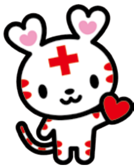
日赤公式キャラクター ハートラちゃん