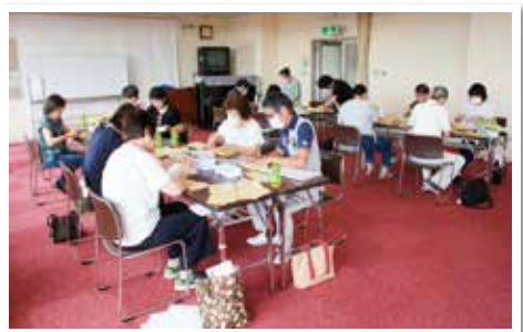
～加須支部敬老会準備の様子～

支部社協が中心となり、地域の方々のご協力のもと、式典やアトラクションなどを開催しています。