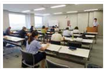
～民協会長会の様子～