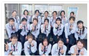
～見守りをしてくれるヤクルト販売員さん～

見守りが必要な「ひとり暮らし高齢者」や「高齢者のみ世帯」を対象に、ヤクルト販売員が週1回訪問し、見守り活動を行っています。