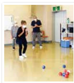
～第1回 ボッチャ体験～

加須市内で高齢者や障がい者の家族を介護されている方などを対象に、介護者同士の交流や心と身体の気分転換をしています。