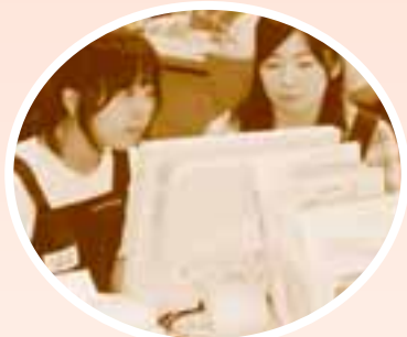
図書館ボランティア