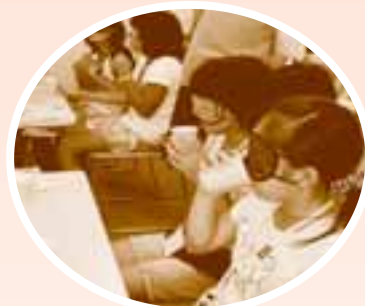
ボランティアスクール