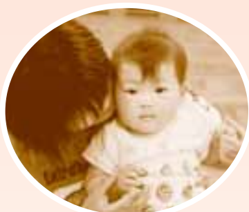
小さな子どもたちと遊ぼう