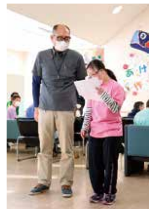
あけぼの園 綱川施設長

ここ数年、利用者が制作する自主製品が減っている中、今回は近隣施設にも販売を通して一緒に作品展に参加していただき、職員だけでなく利用者の方も交流することができました。人と人のつながりが増えイベントの盛り上がりと併せて、とても良い機会になったと思います。これからも皆さんが暮らす地域の施設として「あけぼの園」をよろしく願いいたします。