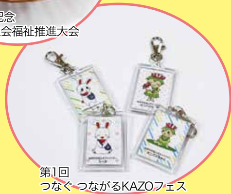
第1回 つながりつながるKAZOフェス

公式キャラクターグッズも作成しています。新たなグッズも検討中なので、ぜひ楽しみにしてください♪