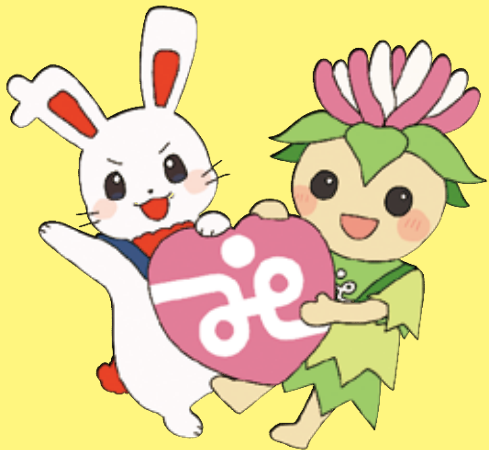
加須市社協公式キャラクター 「う〜か」「オニバスちゃん」

加須市社協合併15周年を記念して、加須市社協公式キャラクターを作成し、社会福祉推進大会でお披露目をしました♪