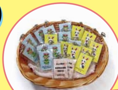
第15回記念 加須市社会福祉推進大会

公式キャラクターグッズも作成しています。新たなグッズも検討中なので、ぜひ楽しみにしてください♪