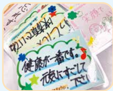
自宅でできるメッセージカードとうちわづくり(夏ボラ)