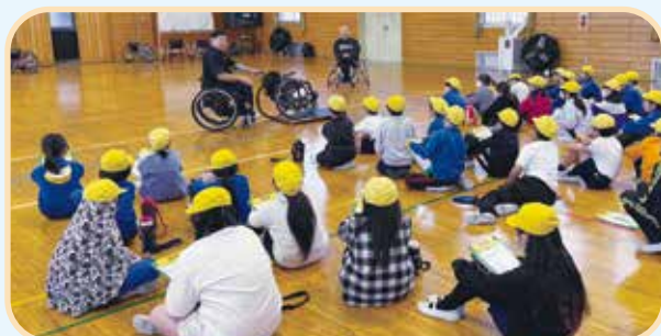
障がい当事者の講話を真剣に聞く児童(福祉教育)