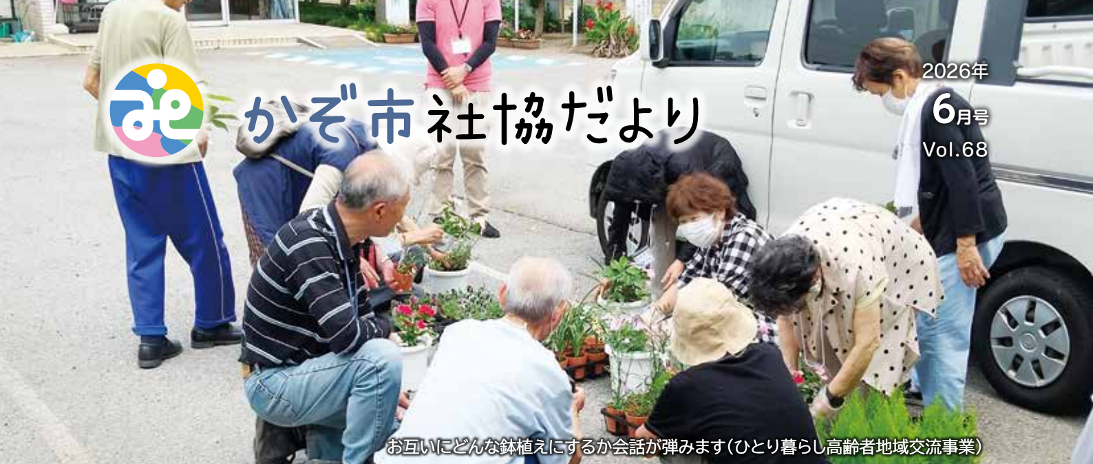
お互いにどんな鉢植えにするか会話が弾みます(ひとり暮らし高齢者地域交流事業)