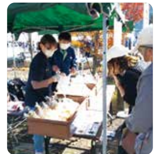
▲第2回つなぐ つながる KAZOフェス

加須市社会福祉協議会は、安心して暮らせるまちづくりを行うために、「ともに生き ともに支え合うまち かぞ」を基本理念とし、それを達成するべく5つの経営理念と基本方針に基づき、事業の展開と組織運営を行っています。