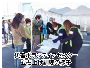
災害ボランティアセンター 立ち上げ訓練の様子