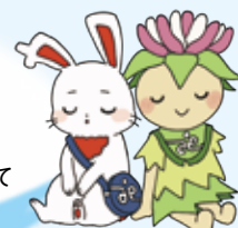
加須市社協公式キャラクター オニバスちゃん&う〜か

社協会費ってなあに? なんのために集めているの? 社会福祉協議会の仕事って? みなさんに少しでもいいから知ってほしいな♪