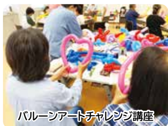
バルーンアートチャレンジ講座