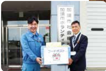
◀こどもの食生活支援事業