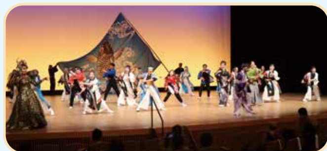
大好評だったどっこいしょ(社会福祉推進大会)