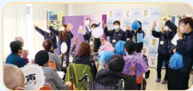
演目前に合いの手の練習!(在宅介護者リフレッシュ事業)